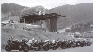
若杉温泉の他にグレンデ等も