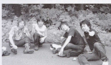
休憩中だけど記念に1枚